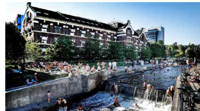
Nydalen, Oslo der de gamle teglsteinsbygningene tilfører bydelen karakter og sjarm.

Bygg bør bygges med kvalitet for flere hundre år. I dag prosjekteres bygg for 60 år eller kortere og mange moderne bygg rives lenge før dette. Vi har i dag mange praktbygg med sterk identitet som står tomme. Hvordan kan vi jobbe med disse byggene som kulturbærere for fremtiden? 20)