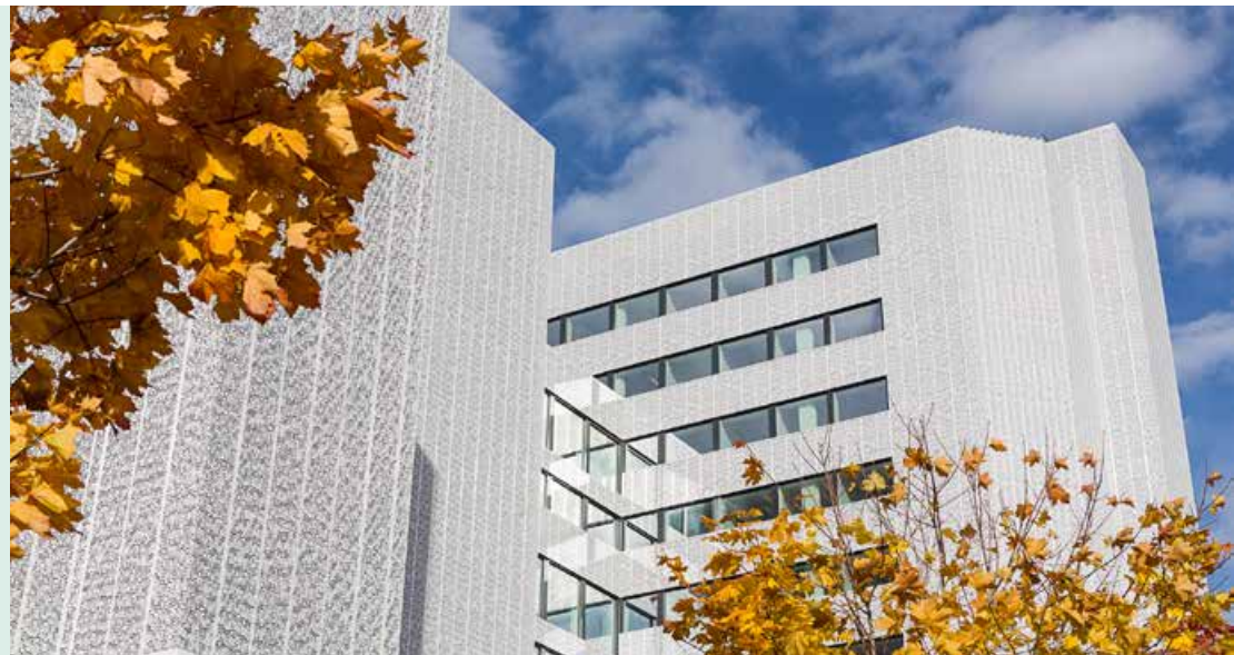
Illustrasjon: Foto: T. Lauluten/FutureBuilt.

I tillegg til mengden av utslipp, er det viktig å vurdere når utslippene skjer. Materialutslipp skjer nå, når det er mest kritisk å redusere, og alle utslipp reduseres i samme år, mens reduksjoner gjort gjennom energibruk gir en langt mindre effekt per år over byggets livsløp.