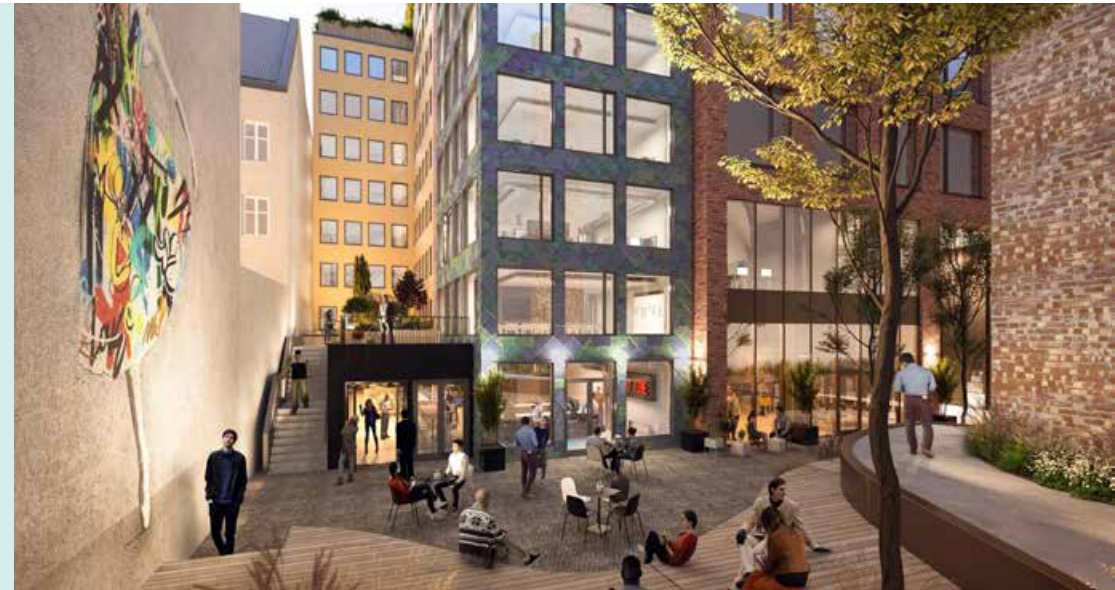
Illustrasjon: Entra ASA/Mad.