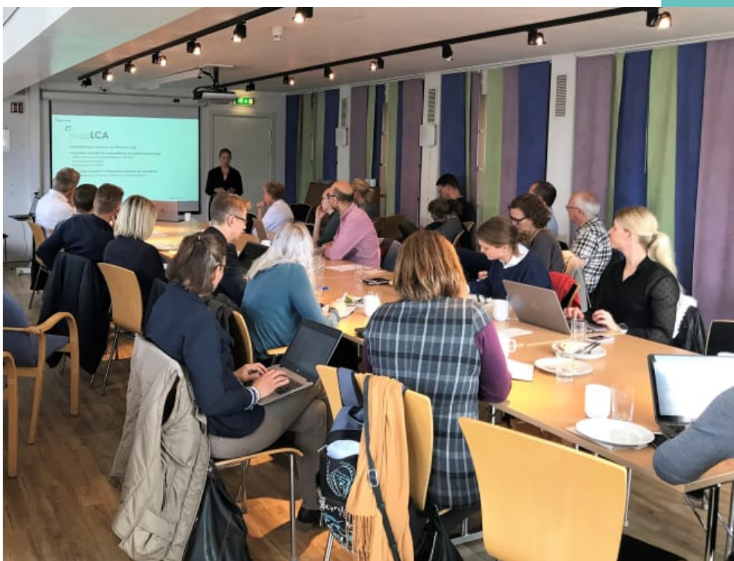
Byggeier-representanter på Grønt ekspertforum 19.9