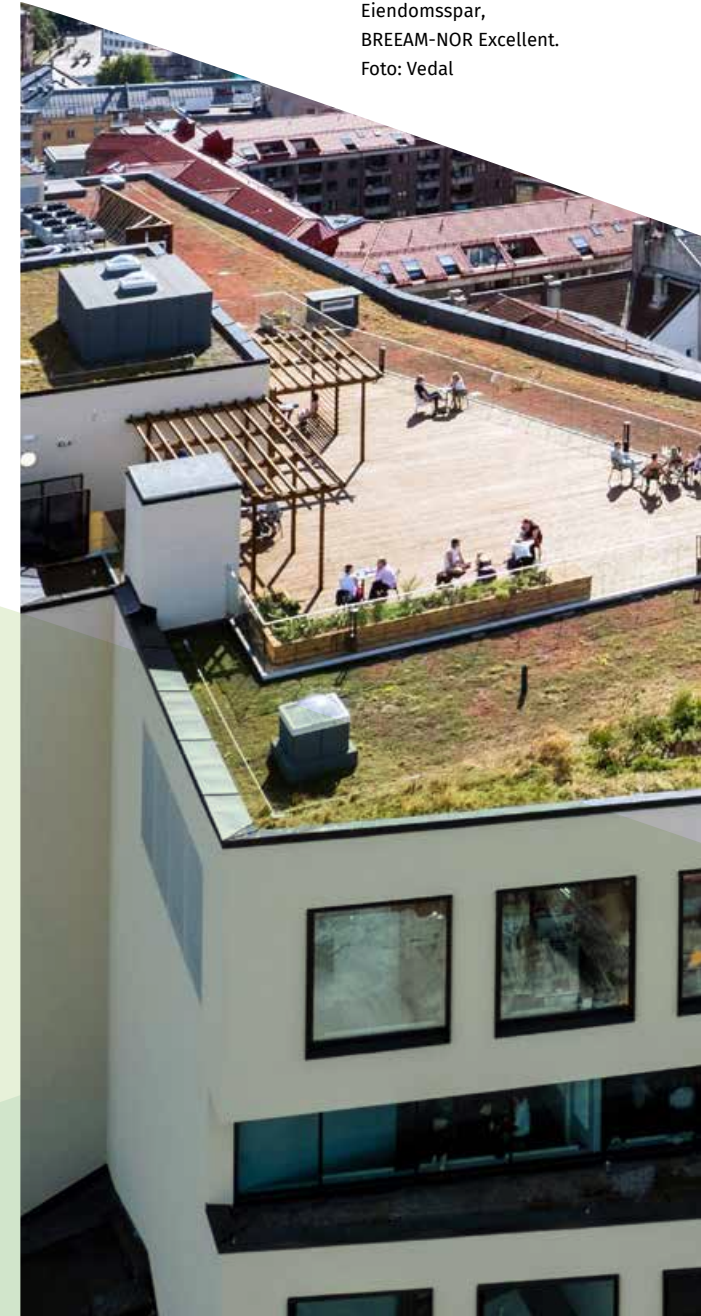
Fabrikken i Urtekvartalet i Oslo, Eiendomsspar, BREEAM-NOR Excellent.

➤ Vi tilbyr et kort introduksjonskurs i bærekraft som strategi for alle nye medlemmer.