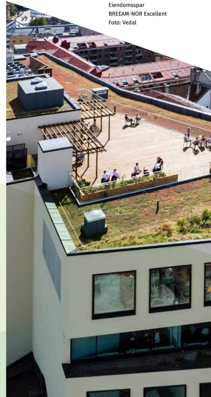
Fabrikken i Urtekvartalet i Oslo, Eiendomsspar BREEAM-NOR Excellent

› I 2022 lanserte EBA også 10 strakstiltak for entreprenører for henholdsvis bygg og anlegg. Disse er utviklet i samarbeid med Grønn Byggallianse. Oppslutningen har vært meget god og over 40 entreprenører har signert. Grønn Byggallianse følger opp disse entreprenørene gjennom vårt samarbeid med EBA.