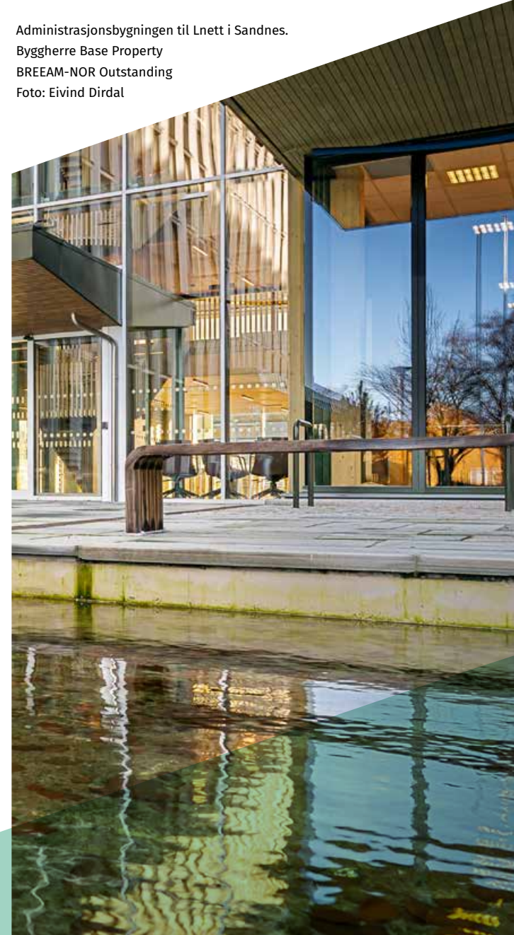
Administrasjonsbygningen til Lnett i Sandnes. Byggherre Base Property BREEAM-NOR Outstanding

Vi har et tett fagsamarbeid med Finans Norge om finansielle rammebetingelser for bygg- og eiendomssektoren, og vil i 2023 fortsette å utfordre myndighetene på avklaringer rundt EUs taksonomi. Vi vil også ha en dialog med ulike banker for å avstemme riktig ambisjonsnivå på kriterier som banker stiller til for grønn finansiering.