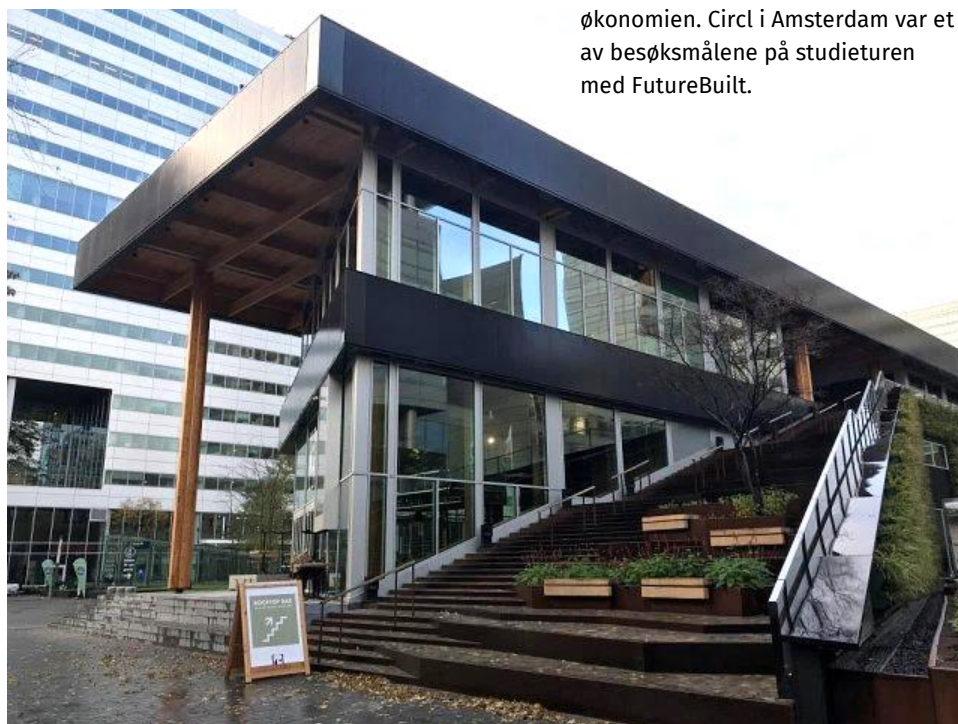
Nederland leder an i den sirkulære økonomien. Circl i Amsterdam var et av besøkmålene på studieturen med FutureBuilt.