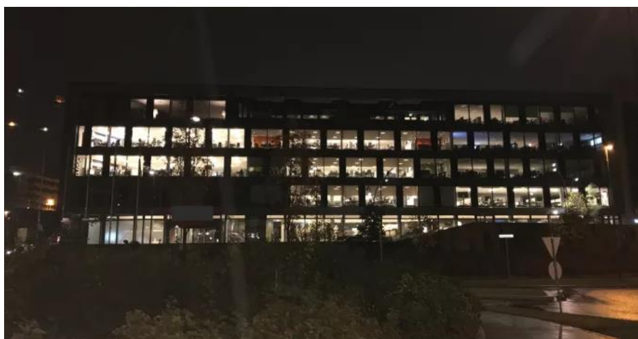
Fang Energytven: BREEAM Very Good-bygning med høy grad av automatisering kl 22:00 11. oktober 2017. Til tross for automatiseringsgraden var det mye lys som ikke slukket selv om arealene ikke var i bruk.

Hver høst oppfordrer vi byggeiere å gå en natterunde på sine bygg for å identifisere energytver. Det er lys, anlegg og utstyr som går unødvendig utenom brukstid. Energytvene kartlegges, beregnes og resultatene presenteres på vår årlige driftskonferanse.