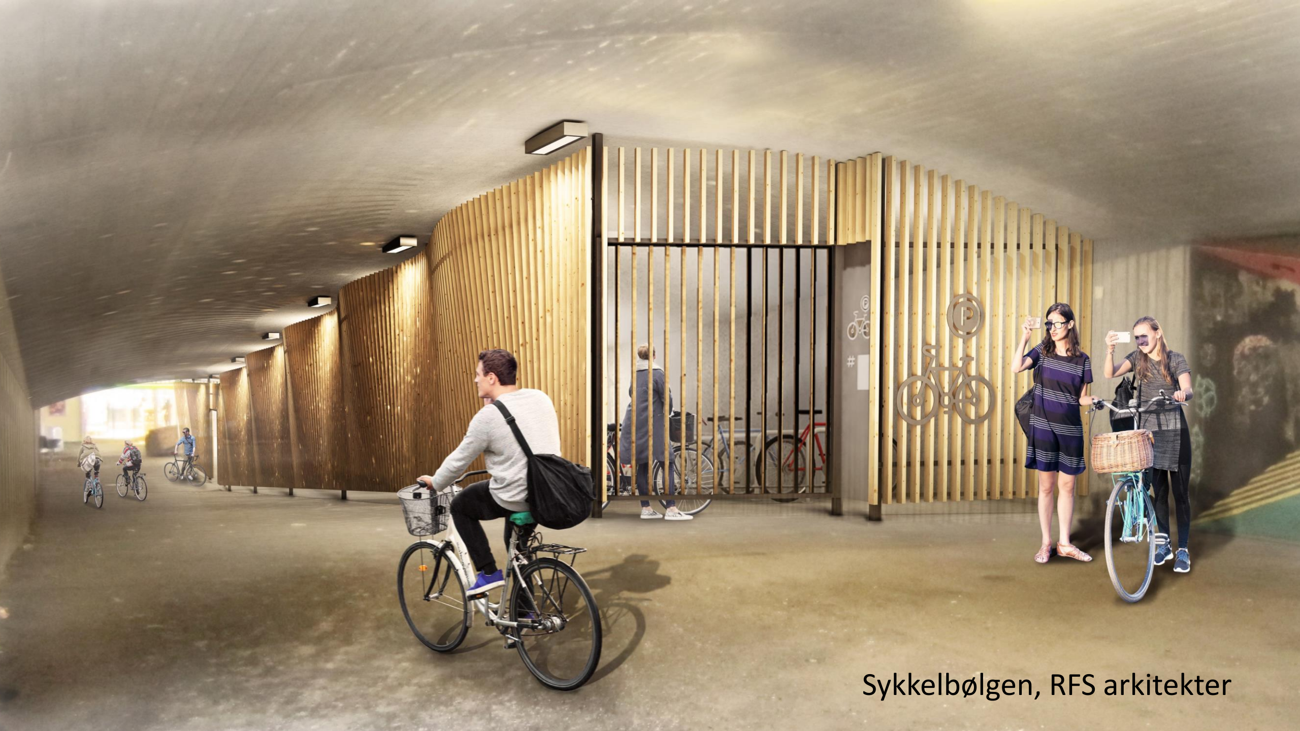
Sykkelbølgen, RFS arkitekter