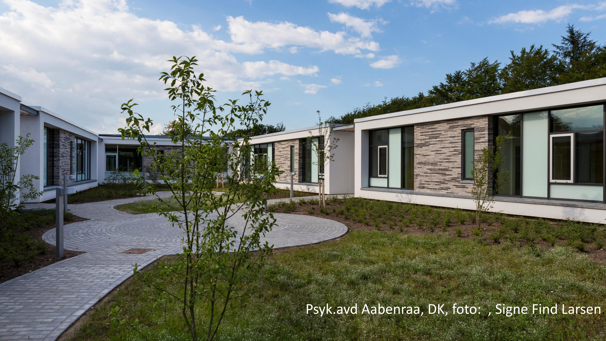
Psyk.avd Aabenraa, DK, foto: , Signe Find Larsen.